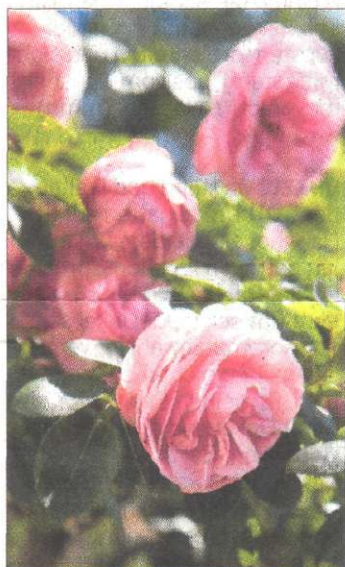
Trägt einen großen Namen: die Sorte „Leonardo da Vinci“.

bis zum Stumpf zurückzuschneiden. „Das muss jedes Frühjahr gemacht werden: Schneiden bis ins gesunde Holz, bis ins weiße Mark - da hilft alles nichts.“